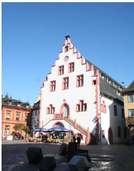
L'ancien hôtel de ville de Karlstadt

Alors, on vous souhaite un très bon séjour.